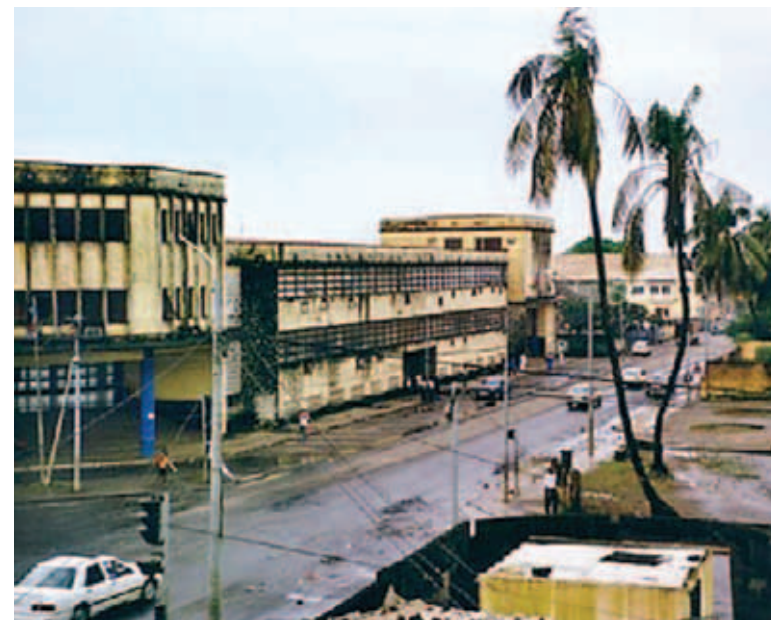
• (Dreta) Instal·lacions de la tenebrosa presó de Black Beach, just al costat del palau presidencial. (Pàgina següent) Carrers d'un barri popular a Bata i vista general de la ciutat de Malabo.

gua potable és del tot impensable, fet que provoca que els presoners acabin patint diverses i nombroses malalties infeccioses. Quant a la higiene íntima, val a dir que se'ls obliga diàriament a fer les seves necessitats en una ampolla de plàstic o en una galleda que buidaran l'endemà. Tampoc no disposen ni de matalassos ni de mantes per dormir, a menys que algun dels seus familiars es pugui fer càrrec de comprar-ne un i aconseguir després dur-lo a la presó. La manca d'electricitat a les cel·les, intenten de compensar-la amb algun orifici situat al bell mig del sostre i a través del qual la llum del dia passa. Encara que, de fet, no solament la llum del dia hi entra: també ho fa la pluja. O els insectes. Tot depèn del temps que faci. Aquestes són, bàsicament, les condicions en què es troben els 150 presoners de la presó de Bata.