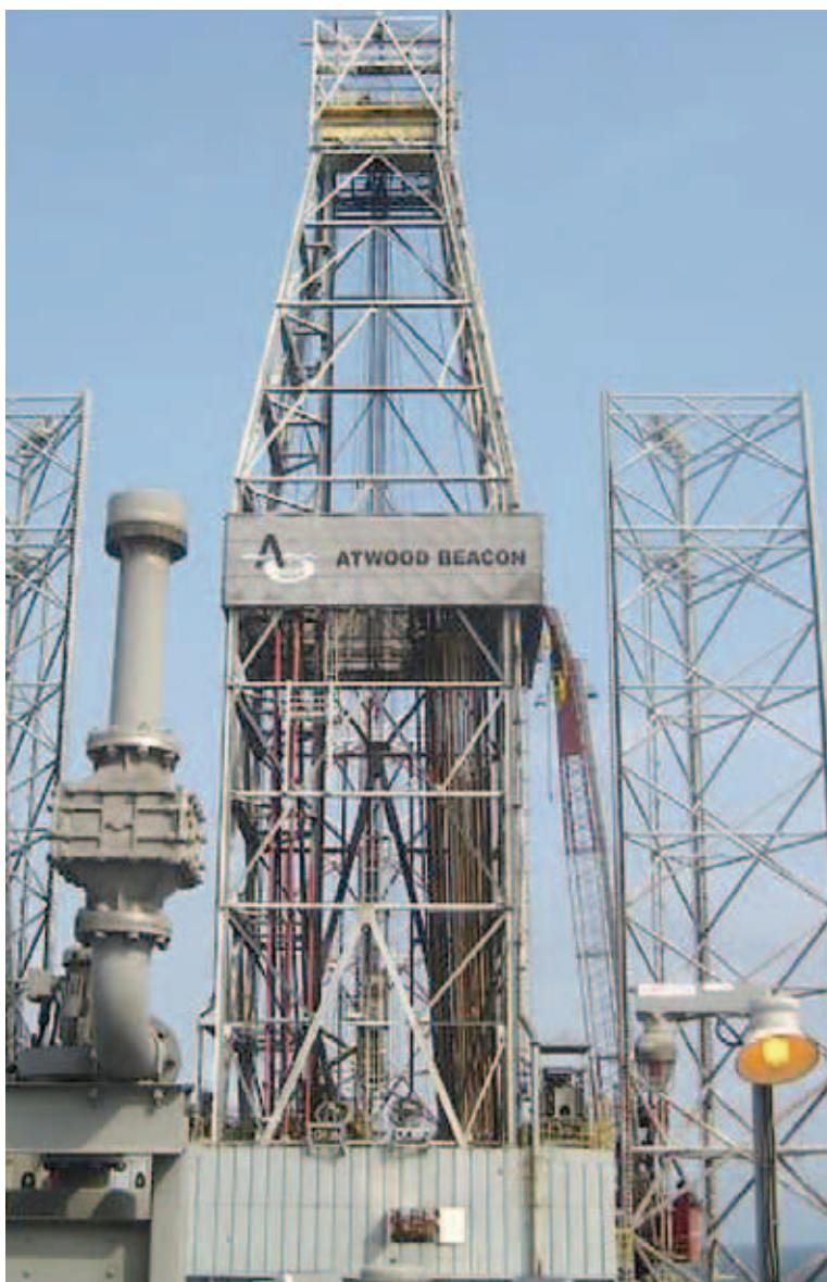
• Les ingents riqueses del petroli només beneficien un 5% de la població.

Lluny de voler comparar la dictadura postcolonial del primer amb la dictadura postmacista del segon, les línies d'actuació en ambdós casos